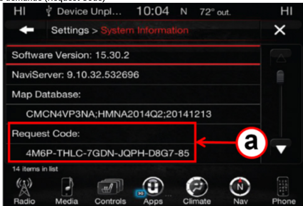
Fig. 3 - Code de demande (Request Code)